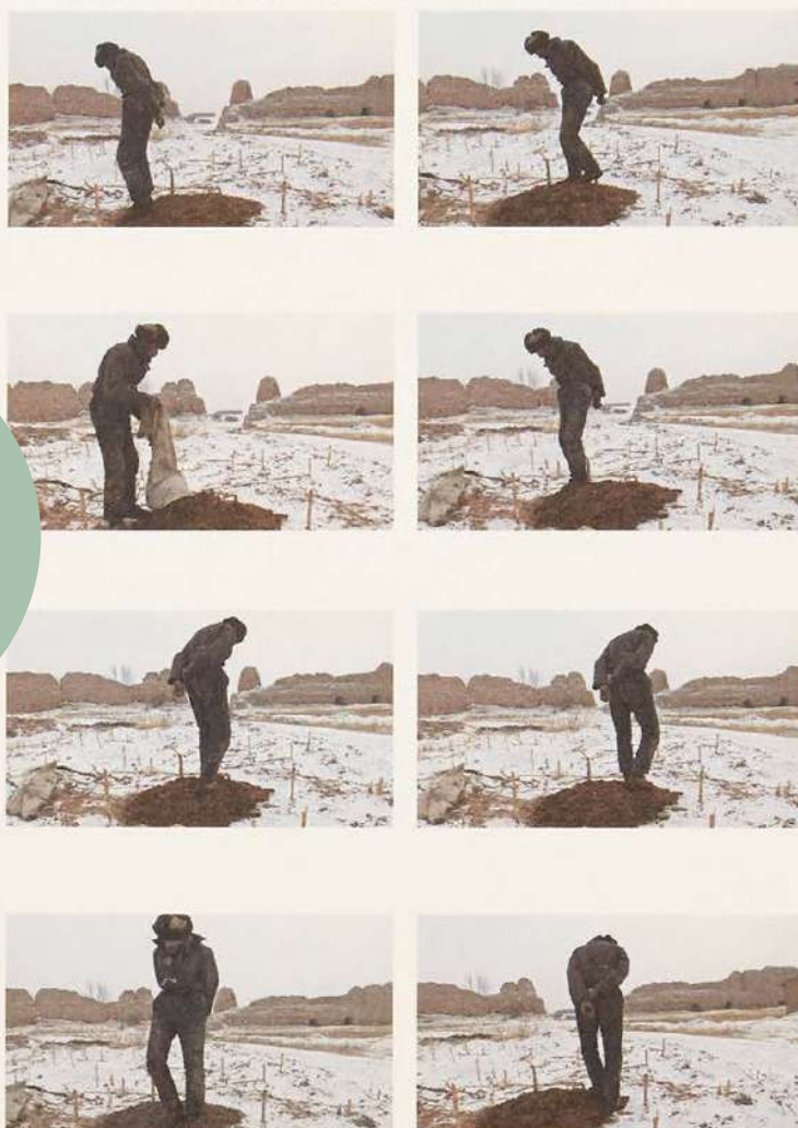
WANG BING – L'ŒIL QUI MARCHE